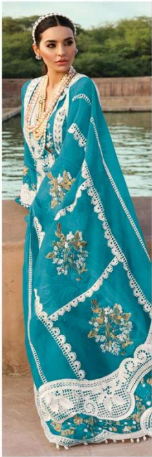
D.NO. 196 H