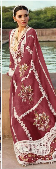
D.NO. 196 J