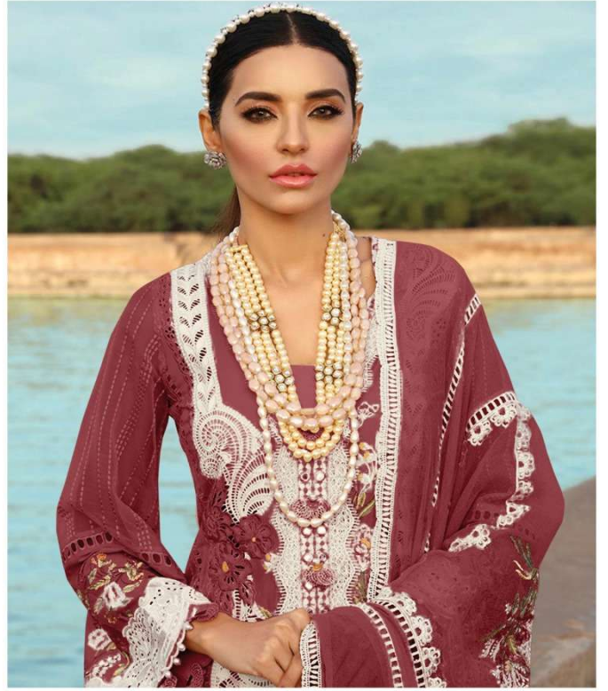
D.NO. 196 J