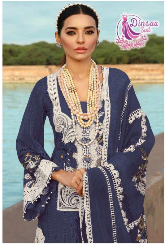
D.NO. 196 I