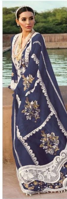
D.NO. 196 I