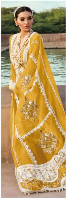
D.NO. 196 F