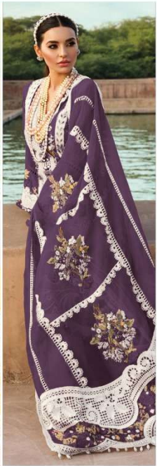
D.NO. 196 G