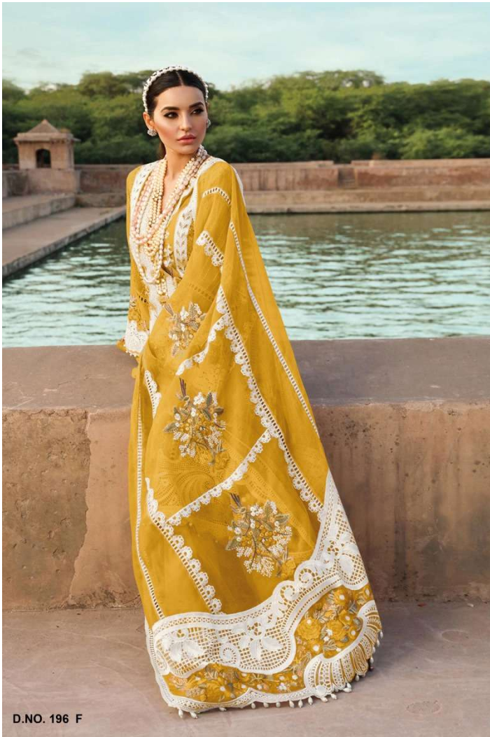
D.NO. 196 F